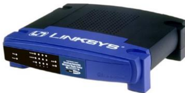
Rys. 1. Router Linksys BEFSR41

Router (ang. trasownik ) jest to urządzenie dzięki któremu możliwa jest realizacja routingu. Zadaniem routera jest określanie tras pomiędzy innymi routerami w swoim najbliższym sąsiedztwie. Urządzeniem takim może być zwykły komputer, którym kieruje specjalnie skonfigurowany system operacyjny np. Linux (router programowy) lub specjalistyczny sprzęt. Najczęściej spotykane w mniejszych sieciach są routery desktop'owe. Routery te cechują się małymi rozmiarami (rys.1).