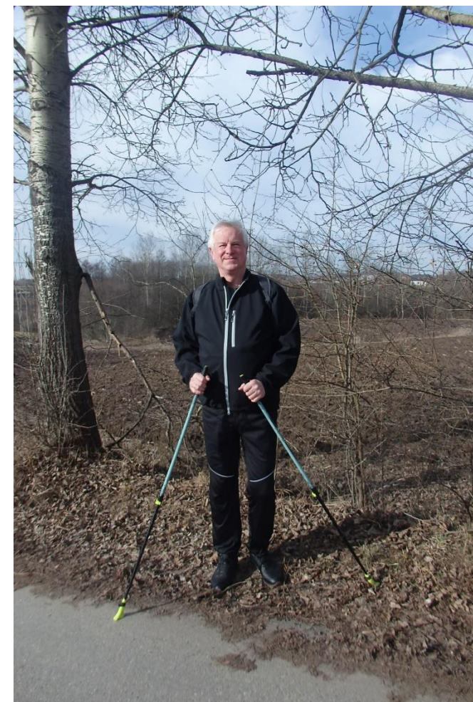
W PLENERZE PODKRAKOWSKIM