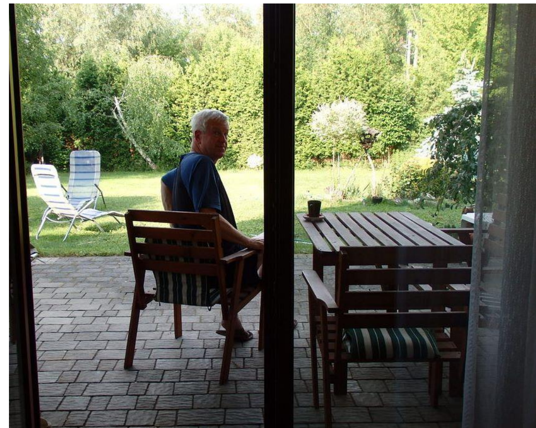
PORANNA KAWA NA TARASIE