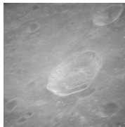
Figure: Tadeusz Banachiewicz, astronom, matematyk i geolog, urodzony 13 lutego 1882 w Warszawie, od 1919 pracował na Uniwersytecie Jagiellońskim, dyrektor obserwatorium astronomicznego w Krakowie, od 1945 roku pracował również na AGH, zmarł 17 listopada 1954 w Krakowie. Zdjęcie Apollo 11 kratera Banachiewicza na Księżycu.

Tadeusz Banachiewicz wynalazł również w 1930 tzw. "Krakowiany" metodę operacji na macierzach A @ B = B^T A która jak obecnie wiemy pozwala przyspieszać obliczenia na komputerach.