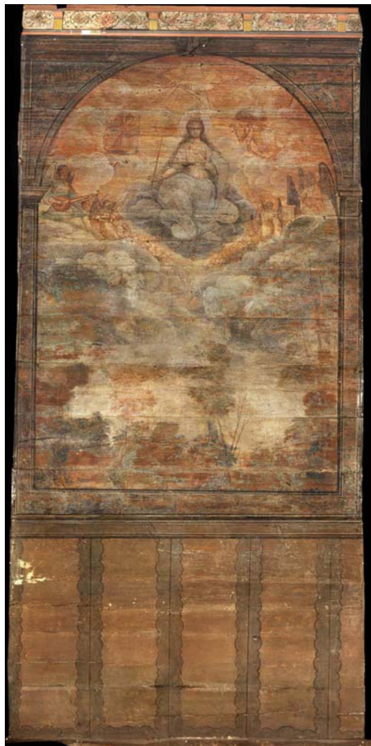
Rys 3. Ortofotoplan polichromia ściany tylnej prezbiterium.

Geotronics z Krakowa. Jest to skaner sferyczny o pionowym zakresie pracy 300^\circ . Instrument osiąga rozdzielczość w pionie 0.25^\circ , 0.0625^\circ w poziomie. Dokładność określenia położenia punktu wynosi \pm 5-10 mm w zależności od mierzonego materiału. Skaner posiada wbudowaną kamerę, służy ona do zgrubnego rejestrowania obrazu, który pomaga w orientacji i stanowić może materiał wizualizacyjny. Wynikiem pracy skanera jest chmura punktów. Pomiar musi być prowadzony z takiej ilości stanowisk, która umożliwi zminimalizowanie cieni (martwych pól). Chmury te muszą być zorientowane. Położenie skanera jest mierzone biegunowo, oraz wyznaczone są współrzędne reflektora, którego położenie jest znajdowane przez skaner podczas inicjacji skanowania. W Michalicach wykonano szereg skanowań wewnątrz i na zewnątrz kościoła, we wieży oraz na poddaszu. Ułatwieniem była okoliczność zbiegnięcia się w czasie skanowania i wymiany części desek poszycia wieży, co pomogło od zewnątrz pomierzyć jej konstrukcję (rys. 4).