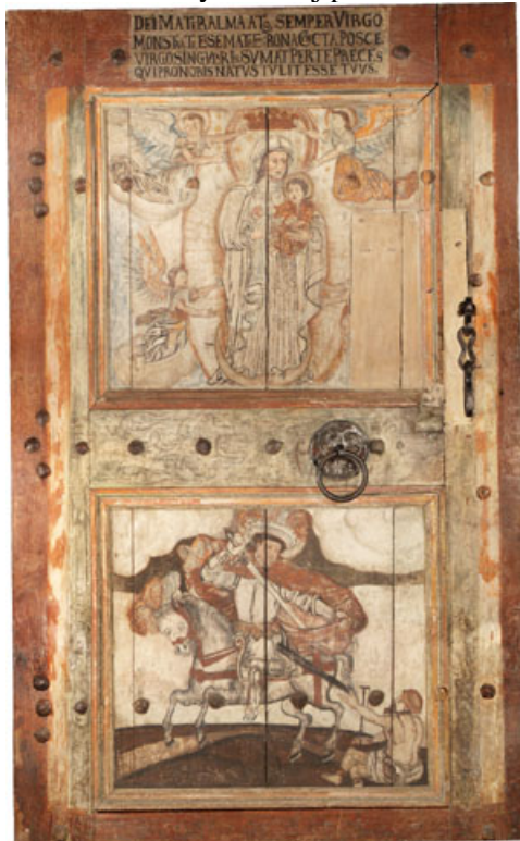
Rys. 2. Ortofotoplan polichromia drzwi do zakrystii.