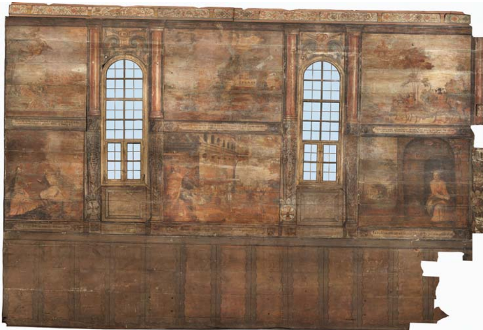
Rys 1. Ortofotoplan polichromia ściany bocznej prezbiterium.