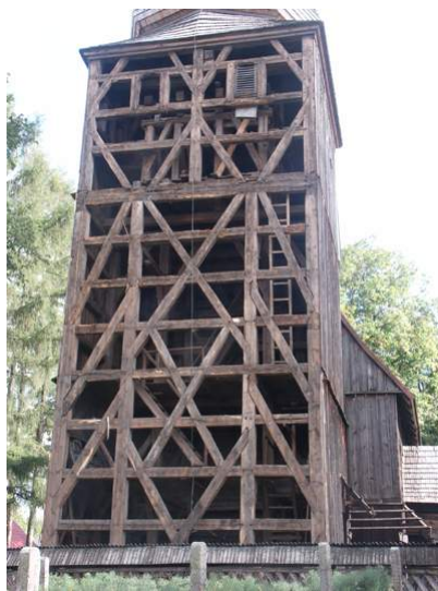
Rys. 4. Widok wieży z odsłoniętą konstrukcją.

W wyniku skanowania i orientacji poszczególnych chmur pochodzących z różnych stanowisk powstała kompletna reprezentacja geometryczną obiektu o dokładności położenia punktu rzędu 10-20mm (rys 5 i 6). Transformację do wspólnego układu umożliwia moduł ScanView programu Dephos . Na jej podstawie wykonano wszystkie materiały architektoniczne. Umożliwiają to funkcje ScanView , dzięki którym można zawęzić chmurę płaszczyznami. Odpowiedni plaster wycięty z chmury podlega obrysowaniu i w ten sposób powstaje odpowiedni przekrój, czy rzut.